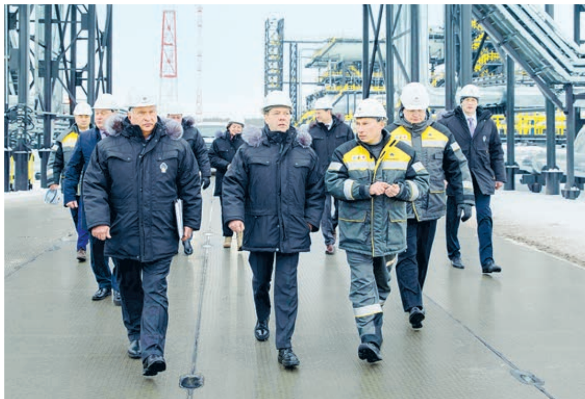
В российском правительстве и администрации ХМАО рассчитывают, что Эргинский кластер станет новым перспективным нефтегазовым хабом.

Глава «Роснефти» пояснил, что в случае с трудноизвлекаемыми запасами технологические инструменты дополняются мерами экономического стимулирования со стороны правительства. «За последние четыре года это позволило компании нарастить добычу на таких месторождениях в 18 раз, – отметил Сечин. – В 2017 году объем добычи составил 15,8 млн тонн, и, по нашим оценкам, добыча трудноизвлекаемых запасов будет расти». Он сообщил, что, по сути, «можно говорить о новом формате освоения месторождений в регионах с традиционной добычей, который заключается в активном вводе в разработку трудноизвлекаемых запасов за счет применения передовых технологий и использования существующей инфраструктуры». «Мы стоим на новом этапе развития нефтедобывающей отрасли Российской Федерации, который позволит повысить ее конкурентоспособ-