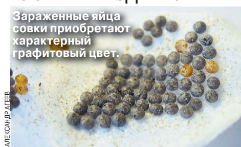
Зараженные яйца совки приобретают характерный графитовый цвет.

Процесс использования талантов ос-паразитов начинается с создания инкубаторов, в которых искусственно разводят бабочек, откладывают яйца. Их собирают и помещают в специальные