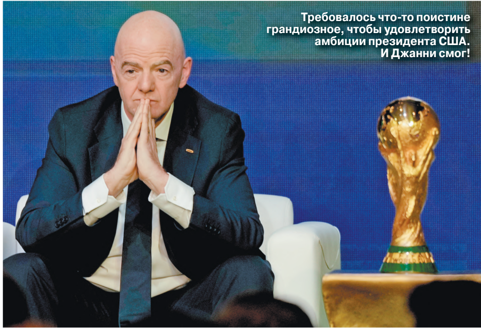
Требовалось что-то поистине грандиозное, чтобы удовлетворить амбиции президента США. И Джанни смог!

Тогда в финальном этапе того ЧМ-1994 играло всего 24 команды, а в отборочном цикле участвовало 148 сборных. Сейчас же в отборочном этапе за право попасть в финал самого престижного футбольного турнира в мире боролось 206 сборных, 48 из которых повезло пройти сквозь сито отбора. Точнее, еще не все, некоторые команды будут играть стыковые матчи, но общее количество финалистов от этого не изменится. Конечно, это чуть меньше, чем было в 2022 году, когда в квалификации участвовало 210 сборных, но все равно можно с уверенностью сказать, что весь мир играет в футбол. Помимо этого появился VAR, увеличилось количество замен в матчах, чемпионат мира стал проводиться в нескольких странах одновременно, а финальный этап турнира 2030 года вообще будет на нескольких континентах — все ради сверхприбыли. Хорошо хоть, «синие» и «зеленые» карточки не ввели, как предлагал руководитель отдела по глобальному развитию игры ФИФА, знаменитый тренер Арсен Венгер. А самое главное — чемпионат мира, как и вся остальная деятельность Международной