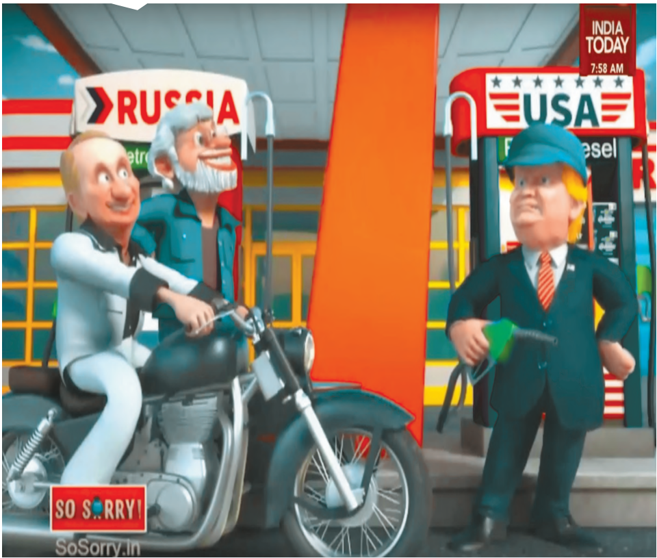
Путин и Моды заправляют свой мотоцикл российским бензином. И через секунду сбивают фуражку с обиженного заправщика Трампа. Кадр из мультфильма телеканала India Today.

На этом фоне понятны истеричные действия Европы, которая изо всех сил пытается напомнить о себе единственным, как считают в ЕС, возможным способом — срывом урегулирования. Ворье, уже не стесняясь, лезет в европейский депозитарий в Бельгии за русскими деньгами. Они же понимают, что деньги нужно успеть украсть сейчас, пока Зеленский сможет их отмыть. Бельгийцы все еще держат оборону, но долго ли продержатся? Торговые суда, связанные с Россией, атакуют в Черном море, в турецкой экономической зоне, «украинские» (в кавычках, потому что ясно, что без Британии