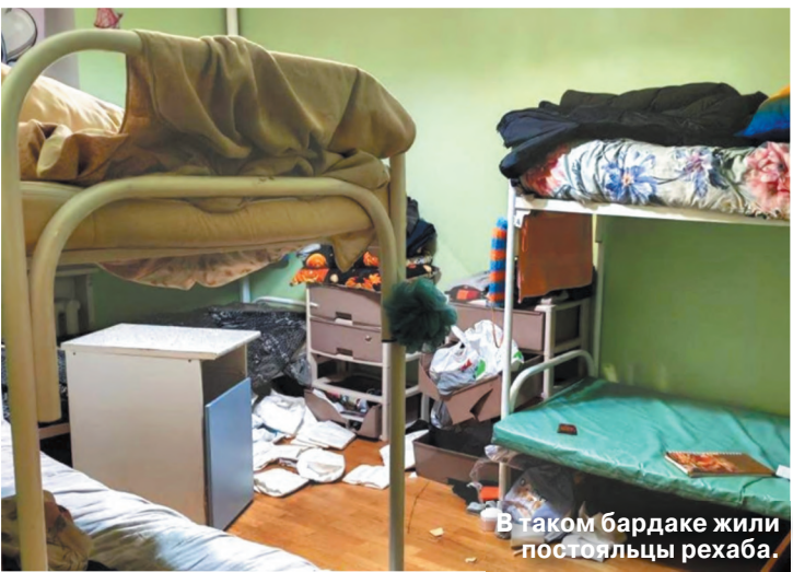
В таком бардаке жили посетители рехаба.