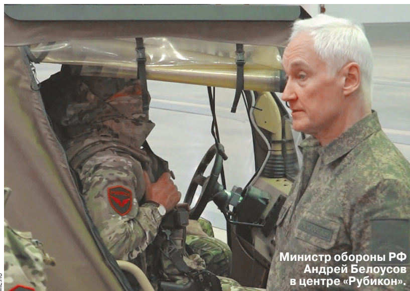
Министр обороны РФ Андрей Белоусов в центре «Рубикон».