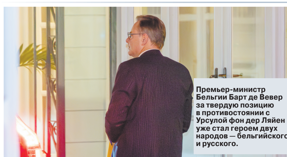
Премьер-министр Бельгии Барт де Вевер за твердую позицию в противостоянии с Урсолой фон дер Ляйен уже стал героем двух народов — бельгийского и русского.

А для того чтобы продолжать поддерживать нынешние украинские власти, Европе требуются именно материальные ресурсы, в первую очередь деньги. А с этим у Европы сейчас все более возмущающий напор. Возьмем, например, Данию — страну, которая потратила на украинский конфликт наибольший процент своего ВВП. Датская помощь режиму Зеленского в 2024 году почти три миллиарда долларов. В 2025 году 2,5 миллиарда долларов. А вот в