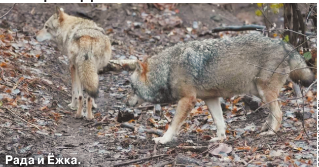
Рада и Ёжка.

Как узнал «МК», серый волк по имени Ёжка прибыл на Пресню из подмосковного Центра воспроизводства редких видов животных. Туда он попал три года назад — его изъяли у контрабандистов. Уперевлюкующий Ёжку большую часть времени жил в тесной клетке и очень плохо питался. Для спасения волка разрабатывали специальный рацион с постепенным увеличением размера порций и обеспечивали ему максимальный