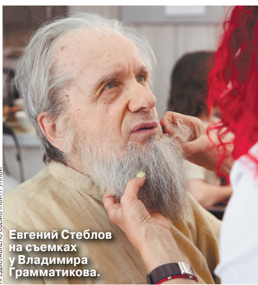
Предоставлено: Съемочной группой