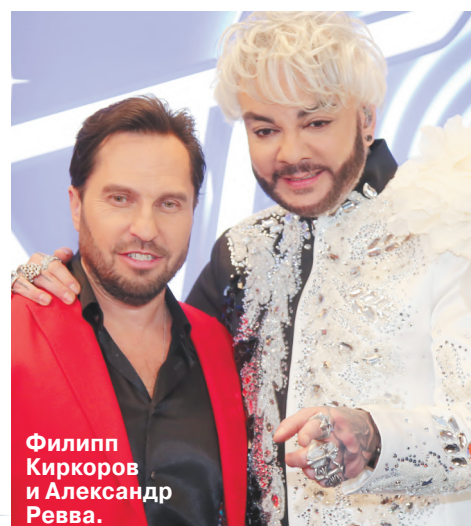
Филипп Киркоров и Александр Рева.