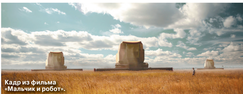
Кадр из фильма «Мальчик и робот».

Не обошлось и без другого популярного в то время вида кукол — французские куклы-бебе с детским лицом и взрослым гардеробом.