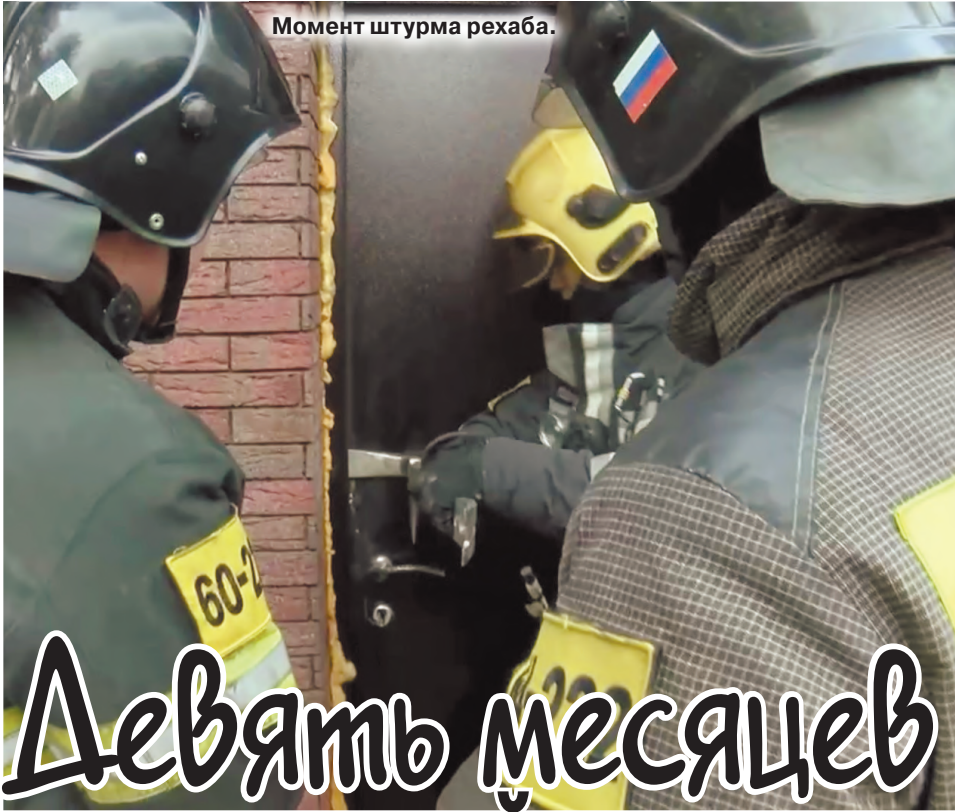
Момент штурма рехаба.

Я пошел туда работать, потому что планирую получить профессию психолога-педагога. Хотел набраться опыта работы с детьми. Но когда увидел, как все устроено, понял, что это не мое. Через месяц у меня уже началось эмоциональное выгорание. Хочу заметить, что госучреждение от платного центра сильно отличается.