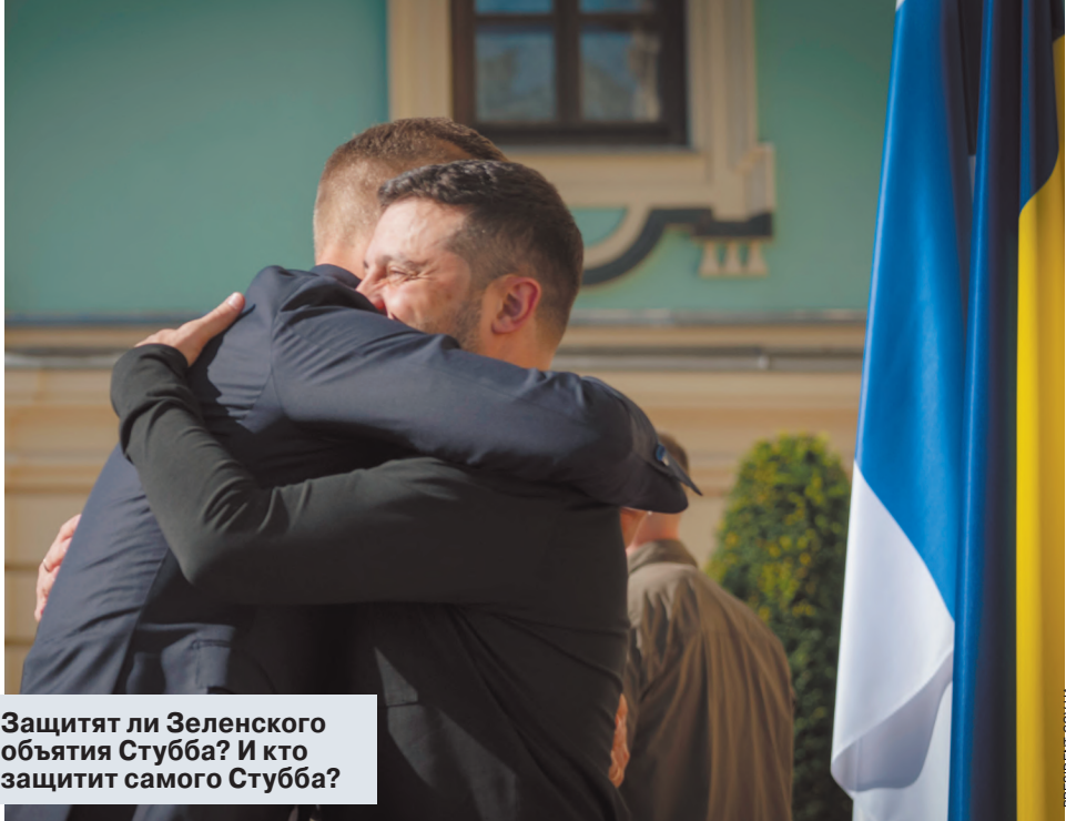
Защитят ли Зеленского объятия Стубба? И кто защитит самого Стубба?

И это ж не интервью чье-то, после которого